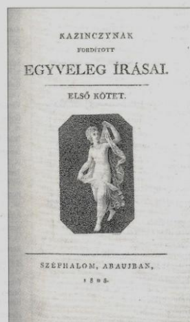
Kazinczynak fordított egyveleg írásai. Széplahalom, Abaujban, 1808

Érdekes története van a kézirategyűjtésnek. A 2000-es évek elején bekövetkezett árrobbanásig szinte minden tétel „bagóért” az OSZK vagy az Országos Levéltár birtokába került, mivel ezek éltek elővételi jogukkal – így a gyűjtők hoppon maradtak. A sokszor milliós leütéseket viszont már nem bírta az intézmények költségvetése, így a gyűjtőké lett a terep. Jelenleg az 1711 előtt megjelent könyvek, a Régi Magyar Könyvtár (RMK) kötetei vannak – mondjuk így – válságban, jóval a reális áron alul kelnek el. Ide sorolhatók a biblikiadások is: csak a nagyon ritkák kelnek el, szinte alapáron. Hozzáteszem azonban, hogy nem tartom véglegesnek ezeket a tendenciákat, szerintem például az RMK-kötetek ára idővel újra emelkedni fog. Szinte teljesen eltűnt a piacról a szamizdatirodalom és az Ideiglenes Nemzeti Kormány által 1945-ben kiadott, tiltott könyvek listáján szereplő megannyi kötet. Ezekhez az 1990-es évekig sem az antikváriumokban, sem az árveréseken