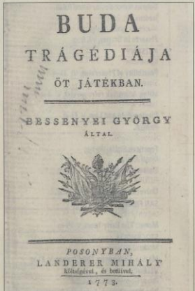
Bessenyei György: Buda tragédiája, 1773

axio art Megtalálja a Műértőt az axioart.com-on is! www.axioart.com