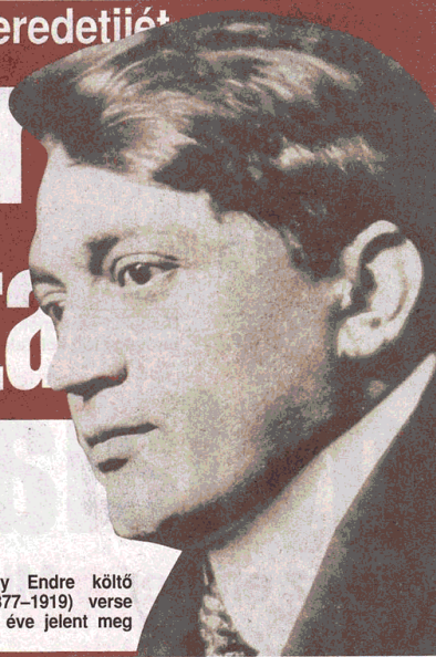
Ady Endre költő (1877–1919) verse 96 éve jelent meg